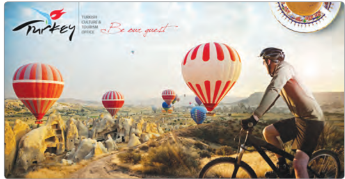
Türkiye turizmi hakkında bir tanıtım afişi

Ülkemizin turizm alanında yürüttüğü başarılı tanıtım kampanyaları sayesinde ortak miras öğelerimiz yurt dışında daha çok tanınmaktadır. Artık ortak miras öğelerimiz yabancı basında sık sık yer almaktadır.